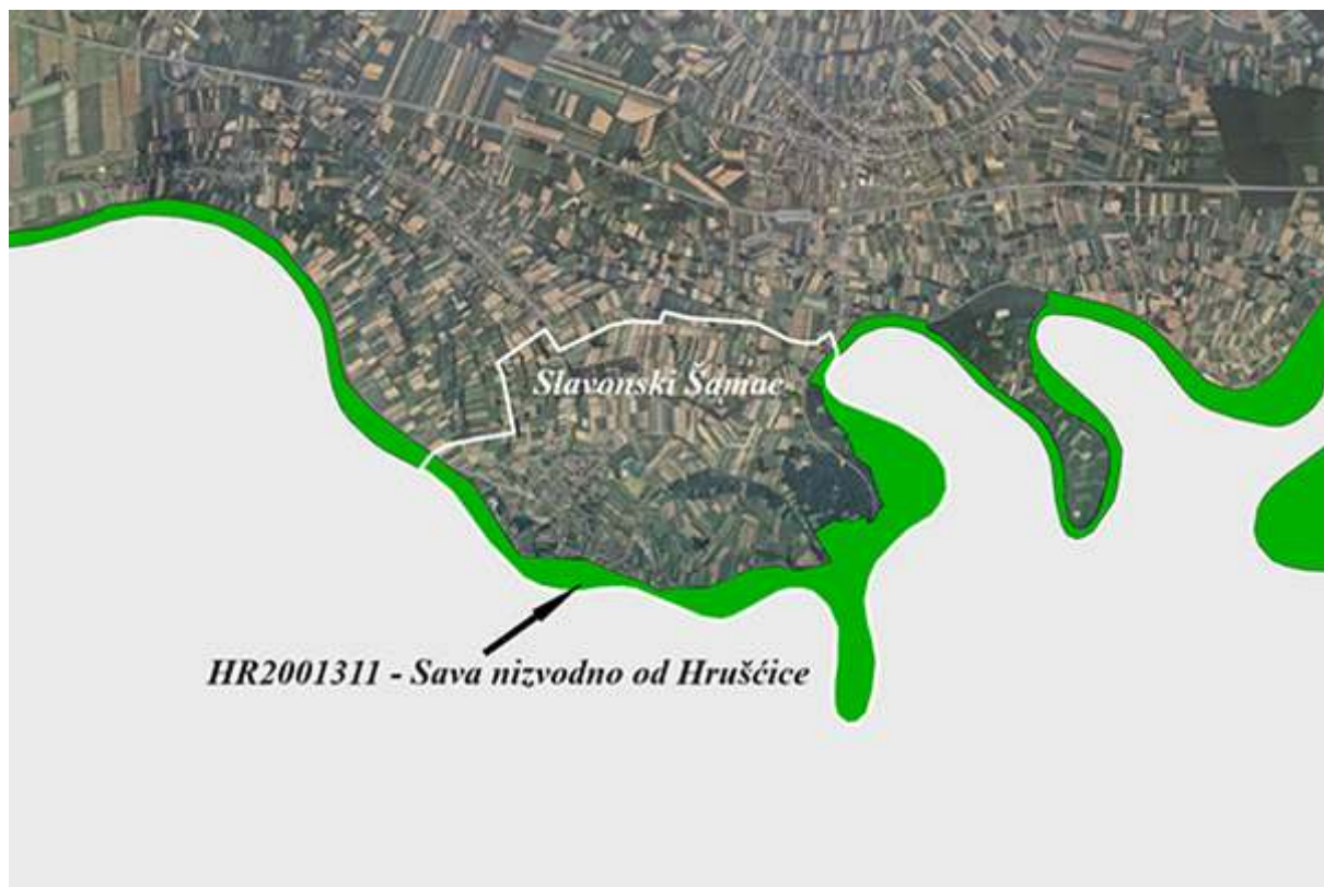
Slika 1: Sava nizvodno od Hrušćice (HR2001311), područje ekološke mreže značajno za vrste i stanišne tipove (POVS)

Unutar obuhvata područja općine Slavonski Šamac, nema zaštićenih područja temeljem Zakona o zaštiti prirode, ali se u prostornom obuhvatu nalazi područje ekološke mreže, na koje može imati utjecaj provođenje odredbi Plana gospodarenja otpadom: