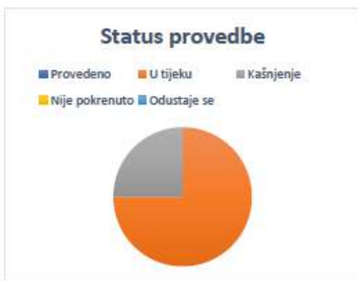
Grafikon 1. Prikaz mjera prema statusu provedbe