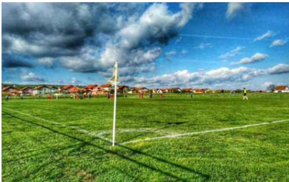
Slika 1. Nogometno igralište NK Slavonca Bukovlje

Na području općine Bukovlje nalaze se dva nogometna igrališta u vlasništvu općine Bukovlje; nogometno igralište NK Slavonca Bukovlje i nogometno igralište NK Bratstva Vranovci.