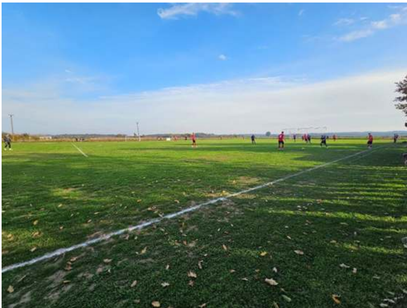
Slika 1. Nogometno igralište NK Bratstva Vranovci