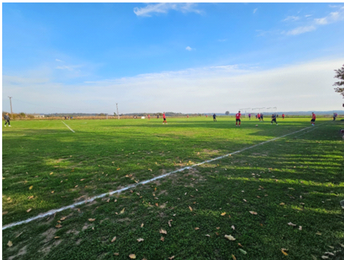
Slika 1. Nogometno igralište NK Bratstva Vranovci

Na području Općine Bukovlje nalaze se dva nogometna igrališta u vlasništvu Općine Bukovlje; nogometno igralište NK Slavonca Bukovlje i nogometno igralište NK Bratstva Vranovci.